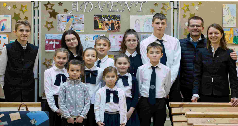
A mezőberényi szavalóversenyen részt vevő csapat