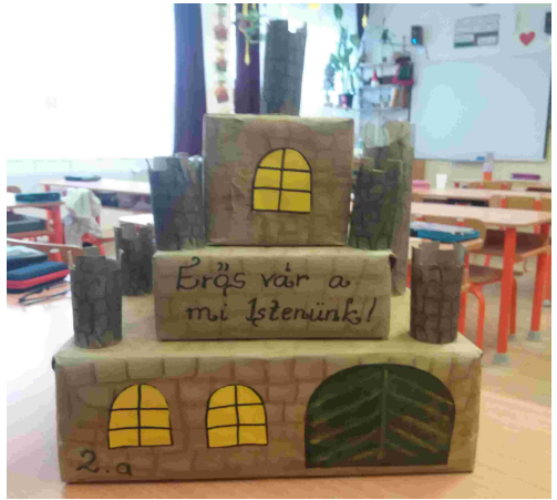
A 2a osztály erős várat alkotott