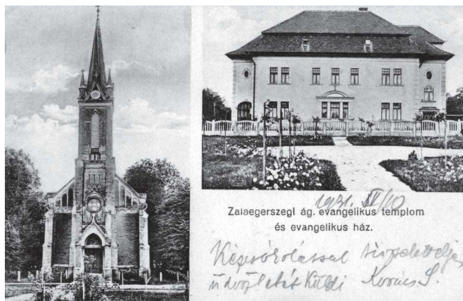
A zalaegerszegi evangélikus templom és evangélikus ház (Zalaegerszeg, 1931)