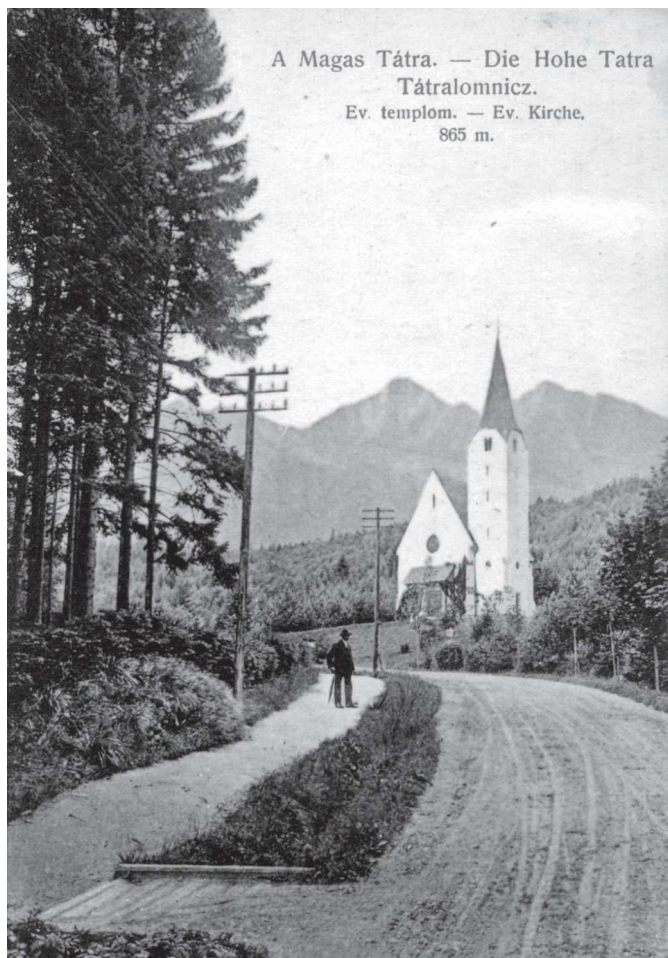
Tátralomnici evangélikus templom (Tátralomnic, 1915)

Kérjük Olvasóinkat, hogy juttassanak el egy jól másolható, érdekes képet a lelké-szi hivatalba (Orosháza, ThékE. u. 2.).