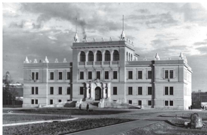
A soproni evangélikus teológia új épülete (Sopron, 1930) Beküldő: Koszorús Oszkár