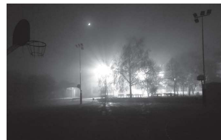
2. hely Balla Bence: Csendélet a diákság második otthonáról