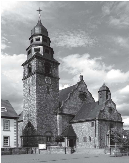
Kahl am Main, evangélikus templom

A hivatalos tárgyalások mellett bepillantást nyertünk az iskola életébe, pedagógiai tapasztalatokat gyűjtöttünk, és megismertük a környéket, ahová majd diákjaink