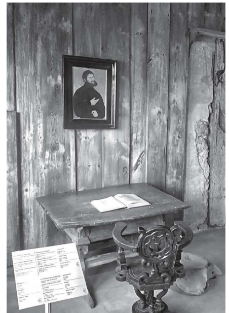
Luther szobája Wartburg várban

A várat elhagyva a városban néztünk körül. Elsőként a Luther-házat kerestük fel, ahol gimnáziumi éveit töltötte. Mindig fel-emelő érzés híres ember személyes dolgait megnézni, megcsodálni, de ebben az esetben mindannyiunk számára különleges élményt jelentett.