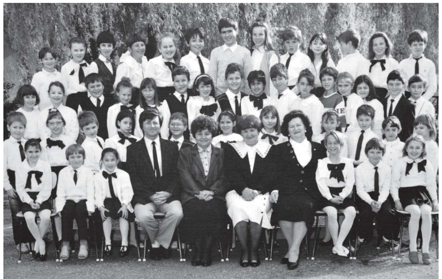
Az első evangélikus iskolai évfolyam (1995)