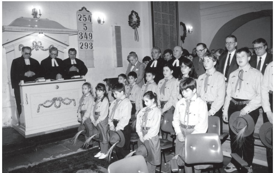
250 éves Orosháza. Ünnepi istentisztelet az evangélikus templomban (Orosháza, 1994)