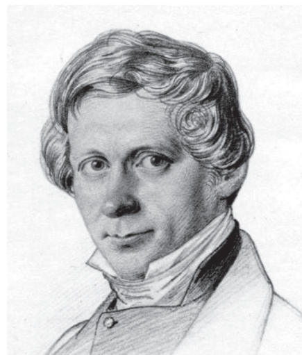
Johann Hinrich Wichern

Véleményem szerint a belmisszióhoz szervesen kapcsolódik a diakónia is, nem feltétlenül intézményes formában, de elengedhetetlenül. Nem szabad a kettőt egy-