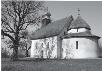
A rotunda Gerényben

Ezután Gerény következett, ahol a kárpátaljai középkori templomok egyik kiemelkedő példányát, a gerényi rotundát te-