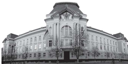
II. Rákóczi Ferenc Kárpátaljai Magyar Főiskola

Az első napon – egy kicsit megfordítva programunkat – meglátogattuk Beregszászon a II. Rákóczi Ferenc Kárpátaljai Magyar Főiskolát, majd egy csodálatos magánmúzeumban tettünk látogatást, ahol a helytörténeti kiállítást tekintettük meg.