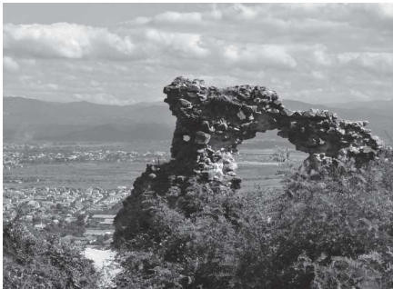
A huszti romvár

☞ 1831-ben vetett papírra, hiszen a huszti romvár meglátogatása felejthetetlen élmény volt számára.