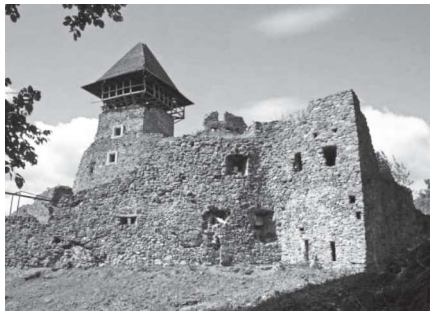
A Nevickei vár

A Turja völgyén haladtunk tovább, ahonnan szintén gyönyörű volt a kilátás a Róna-havasra és a Makovicára. Turjareme-