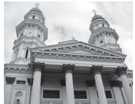
Az ungvári székesegyház

Lelkészünk alázattal szolgálta utunkat az esti alkalmakon, ahol az imádság fontossága állt a központban. Szavait idézve: „Sokan úgy érzik, hogy a nyugdíjas évek alatt mindent be lehet majd pótolni, amit az életükben elmulasztottak, de a tapasztalat azt mutatja, hogy az időzavar nem szűnik meg az aktív életszakasz lezárását követően. Jézus napjai is zsúfoltak voltak, de az imádságra mindig volt ideje. Ez lehet a mi életünkben is a példa.”