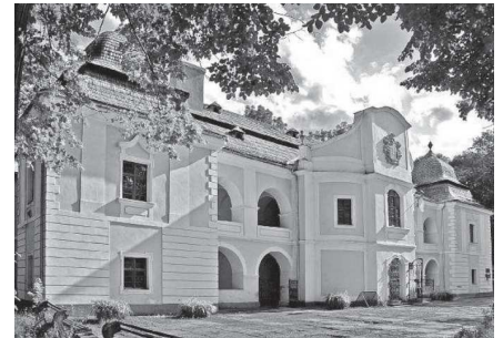
A Perényi-kastély Nagyszőlősen

Nagyszőlősen a Perényi-kastélyt néztük meg először, mely a Fekete-hegyhez közeli gyönyörű, gondozott parkban áll. Az épület barokk stílusú, falán emléktábla hívja fel a figyelmet a család nevezetes tagjára, báró Perényi Zsigmondra, aki az 1848/49-es szabadságharc vértanúja volt. A kastély homlokzatán elhelyezett emléktáblán Kosuth Lajosnak báró Perényi Zsigmondról szóló szavai olvashatók: