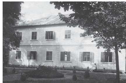
Az egykori Napsugár Szálló, melynek falán a tábla áll

Az emléktábla Justh Zsigmond 1863–1894 a pusztaszentetornyai parasztszínház nemeslelkű alapítója tiszteletére születése centenáriuma emelte Orosháza Város Tanácsa