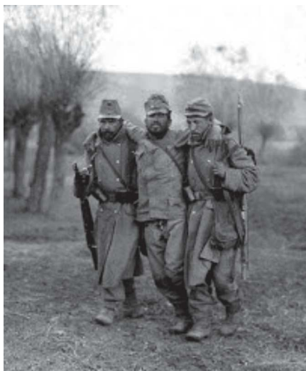
Az osztrák–magyar hadsereg két katonája sebesültet támogat az orosz fronton