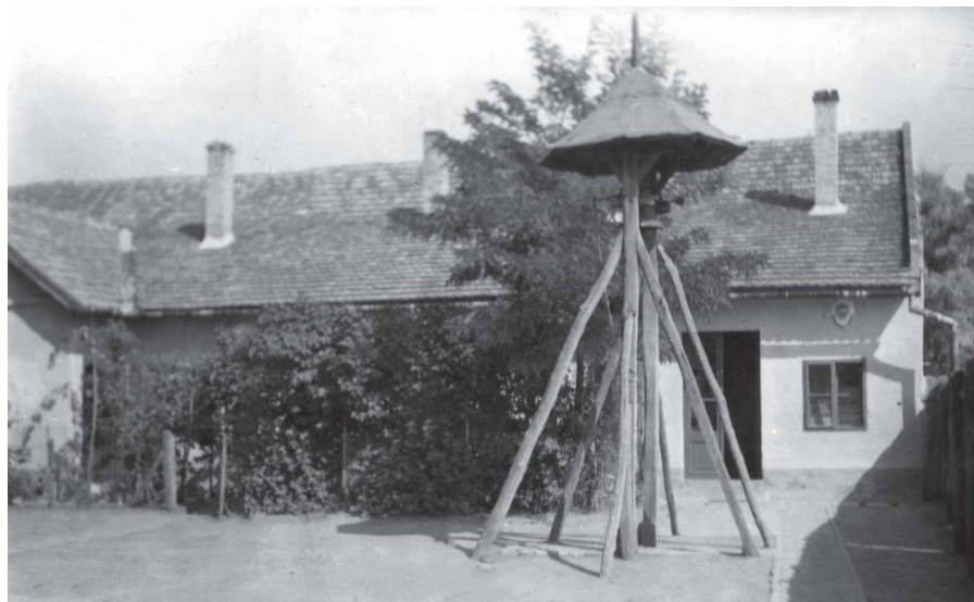
Az 1872-ben átadott kiscsákói evangélikus iskola a haranglábbal