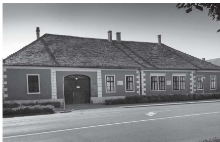
A családi fészek, ahová a gyermekek születtek