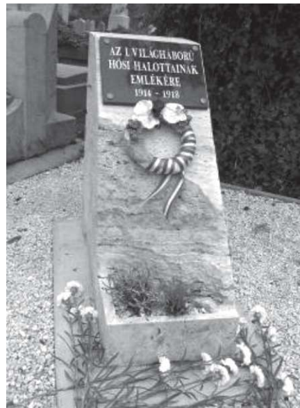
Alkotó: Bánfi Antal orosházi kőfaragó

A „Nagy Háború” átrajzolta az emlékeket, a lelkeket és a térképeket. A temetőben a háború áldozatainak (számunkra ismeret-