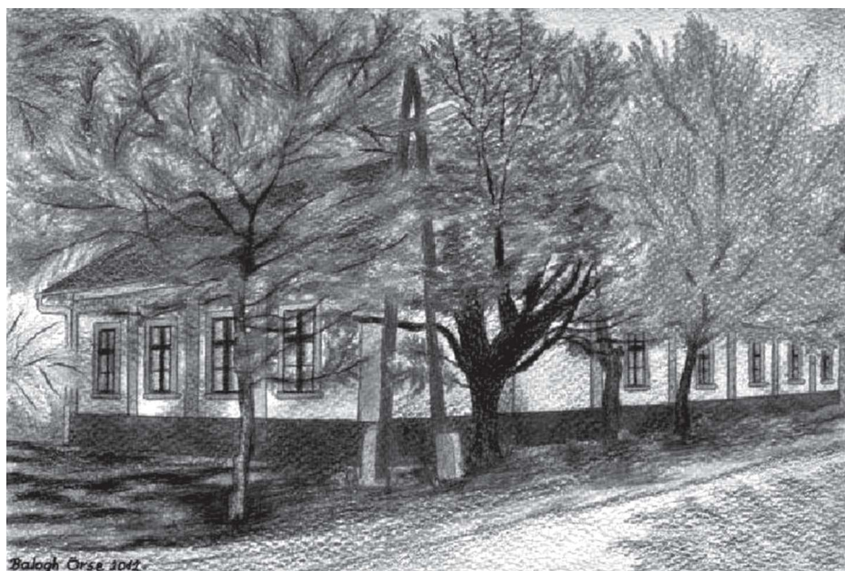
A volt iskola épülete (ma Zombai utca 63. sz.)