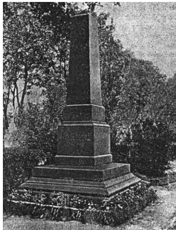
Székács József püspök síremléke

Ezt ma szociális érzékenységnek szokás nevezni. Ez a mások iránti segíteni akarás benne önzetlenséggel is párosult. A tanítók fizetését az egyháztanáccsal 1200 forintba emeltette akkor, amikor a saját fizetése 800 forint volt. [5] A lelkészek fizetésének egy másik része pedig akkor még a kötelezően előírt stóla volt a keresztelések, az esketések és a temetések alkalmával, amit nem mindenki tudott könnyen megfizetni. Székács erről azt írja: „Én ellenben, kezdő fiatal ember, minden szegénynek örömet szolgáltam ingyen”. Ugyanígy gondolkodott Lang Mihály lelkészártsa is, a német gyülekezet