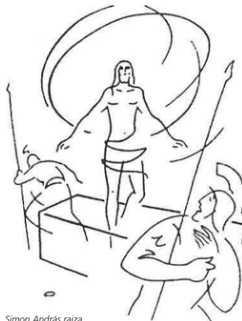
Simon András rajza

helyzetben ne vallották volna be, ha csak kitalálás és hazugság az egész! Amikor vitték őket a bitóra vagy a vadállatok elé, egészen biztos, hogy félelmükben, kétségbeesésükben könyörögtek volna az életükért, vagy legalább egy-kettő adódott volna közülük, akik ezt cselekedték volna, ún. beismerő vallomást tettek volna, s esetleg még ecsetelték is volna, hogyan és mikor és milyen feltételekkel találták ki az Úr Jézus feltámadásának az esetét. Ez lehetett volna a nagy összeesküvés! Az apostolok – ismerve emberi