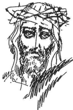
Simon András rajza

E két alkalom segít elgondolkodni a Jézus munkáját előkészítő, Keresztelő János által hordozott, közvetített üzeneten és a húsvéti események jelentőségén, igazi mondanivalóján.