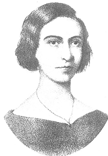
A fiatal Szendrey Júlia