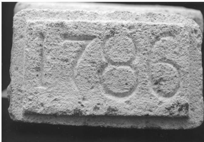
A ládika fedelén a templom építésének ideje: 1786

lönböző újságok legtöbbször pontosan leírják az üzenetek szövegét is. 215 éve azonban még híre-hamva sem volt a környékünkön semmiféle újságnak, még egyházi jegyzőkönyveink sincsenek ebből az időszakból.