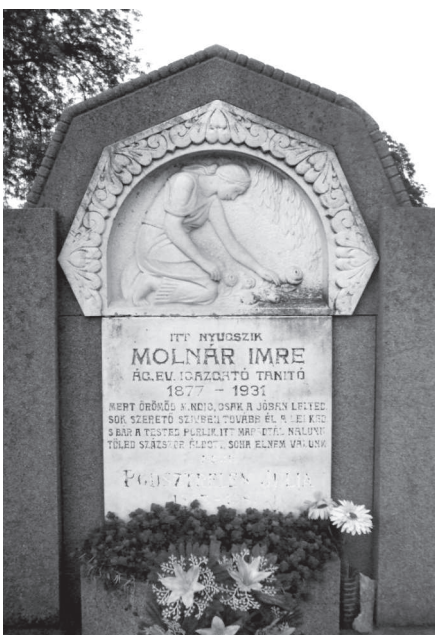
Molnár Imre síremléke az Alvégi temetőben