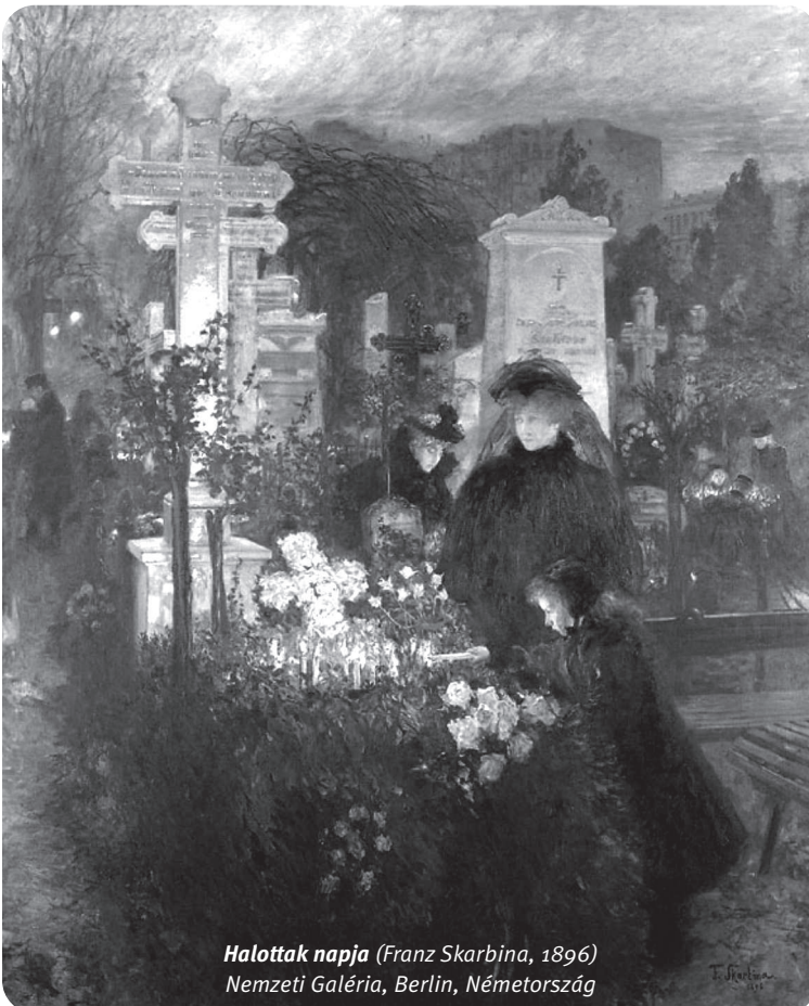
Halottak napja (Franz Skarbina, 1896) Nemzeti Galéria, Berlin, Németország