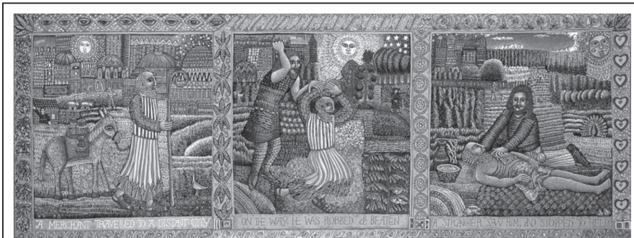
Irgalmas szamaritánus (August Swanson, 2002)

E zt olvastam a bibliaolvasó útmutatóban, s kissé elgondolkoztam az idézetten. Meggyőződésem, hogy ez lehet a diakónia vezérlő és irányító üzenete. Valóban így látom, ha végigtekintek kicsi, de annál lelkesebb csapatunkon, melynek tagjai szeretettel, együttérzéssel igyekeznek mindent megtenni az egyedül élő és megértésre, szeretetre vágó idős emberekért.